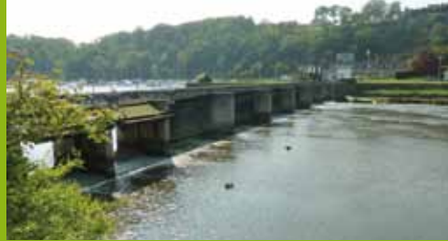
≡ Écluse du Châtelier - Saint-Samson-sur-Rance