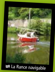
≡ La Rance navigable