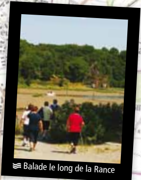
Balade le long de la Rance