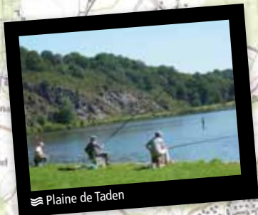
Plaine de Taden

ruisseau du Val-Orieux et continuez par le sentier qui mène sur l'Eperon Barré (prendre le petit chemin balisé en jaune sur votre gauche qui descend vers la Rance). Vous arrivez à une cale avant de remonter et de gagner le hameau du Chatelier. Empruntez la route qui traverse le village. Au carrefour, prenez à gauche l'impasse du val, puis le petit chemin à droite qui descend. 4 Descendez et suivez le chemin pavé. Continuez par le sentier qui franchit le vallon et débouchez sur une route. Prenez-la à gauche. Admirez le superbe panorama sur la vallée de la Rance en bord de route. Poursuivez jusqu'en vue de la D 57. 5 20 mètres avant le carrefour, à l'angle de la maison, descendez à gauche par le petit sentier encaissé. Continuez à descendre par la route jusqu'au port du Lyvet. Utilisez la digue à droite puis l'écluse pour franchir l'estuaire. 6 Contournez la maison de l'éclusier et empruntez à gauche le chemin de halage sur 7 km jusqu'au port de Dinan. Traversez le vieux pont à Dinan puis tournez à gauche pour revenir à la Maison de la Rance.