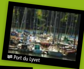
≡ Port du Lyvet