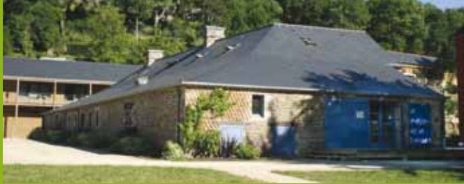
≡ Maison de la Rance - Lanvallay